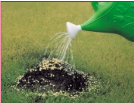
La mayoría de los productos granulados contiene un insecticida que se libera al suelo cuando se empapa con agua.