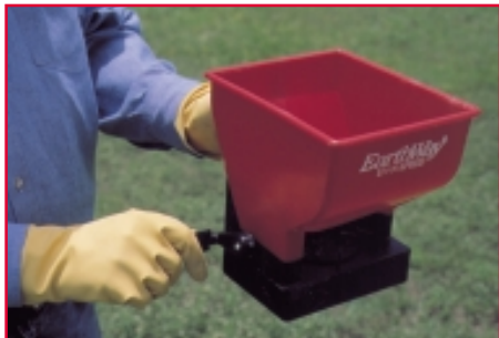
Use un esparcidor de semilla manual para aplicar el cebo para las hormigas bravas.

Las aplicaciones durante el otoño sirven para reducir la cantidad de hormigas la próxima primavera. En el invierno, las hormigas bravas casi no buscan alimento y raramente recogen cebo.