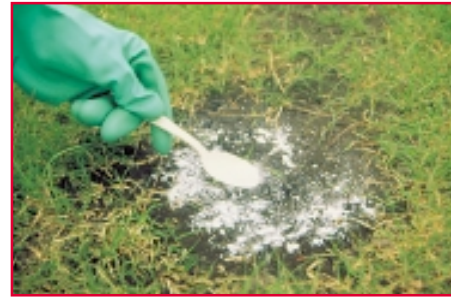
Los polvos secos son convenientes y fáciles de aplicar.